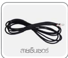
สายเซ็นเซอร์